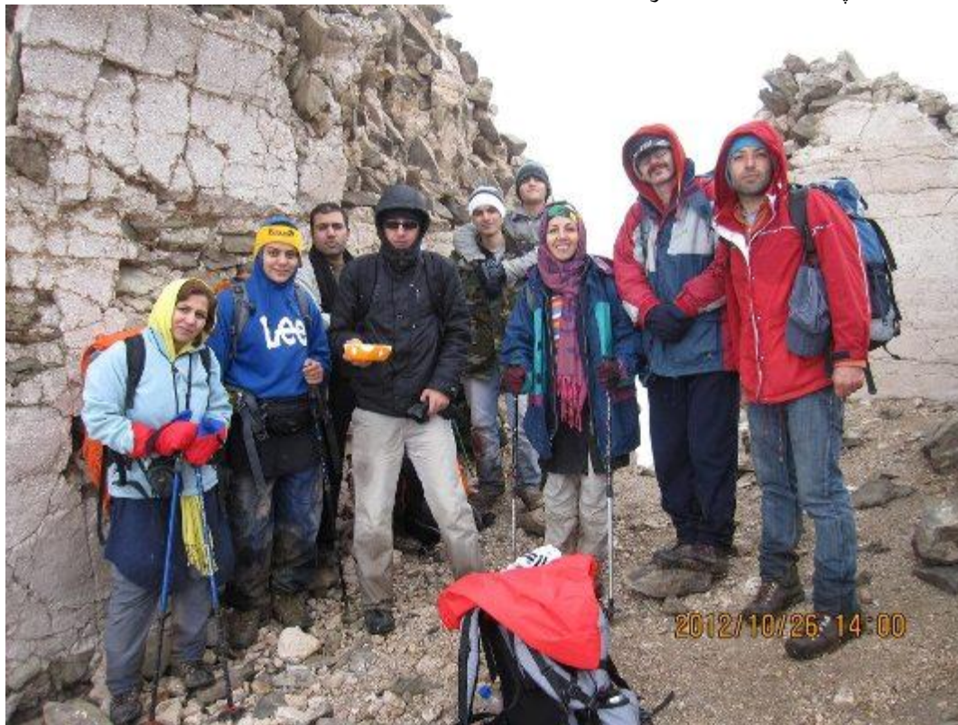
عکس های برنامه: