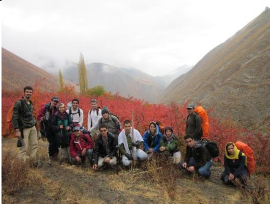
چکاد قلعه دختر: